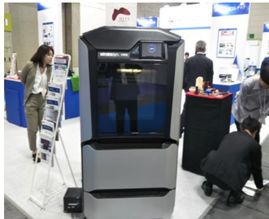
丸紅情報システムズ