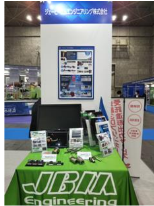
ジェービーエムエンジニアリング